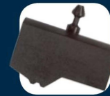
Die sets for brake & Air conditioning hoses